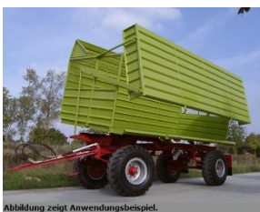
Abbildung zeigt Anwendungsbeispiel.