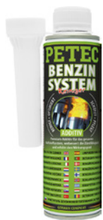
Art.-Nr. 80750 300 ml Dose